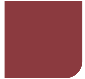
Rojo Óxido 925MC