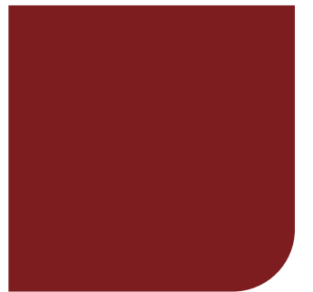
Rojo Óxido 925BC

* Los colores presentados en esta carta pueden variar levemente en tonalidad y brillo con respecto a la pintura aplicada debido a las condiciones de luz y superficie. Por favor confirme el color en su punto de venta preferido.